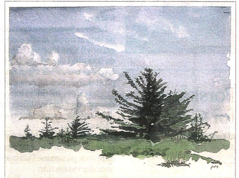
ANDRE AKVARELLER er mere naturalistiske - her er det "Vindsiden"